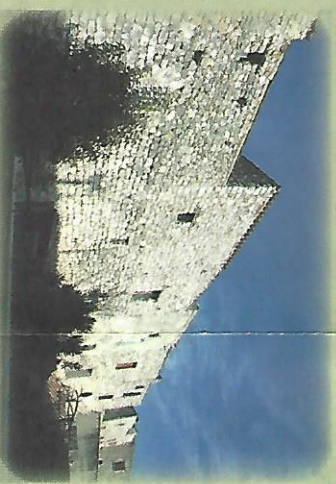
7 Städtliche Stadtmauer 14. Jahrhundert